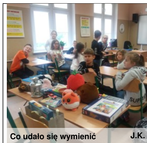
Co udało się wymienić